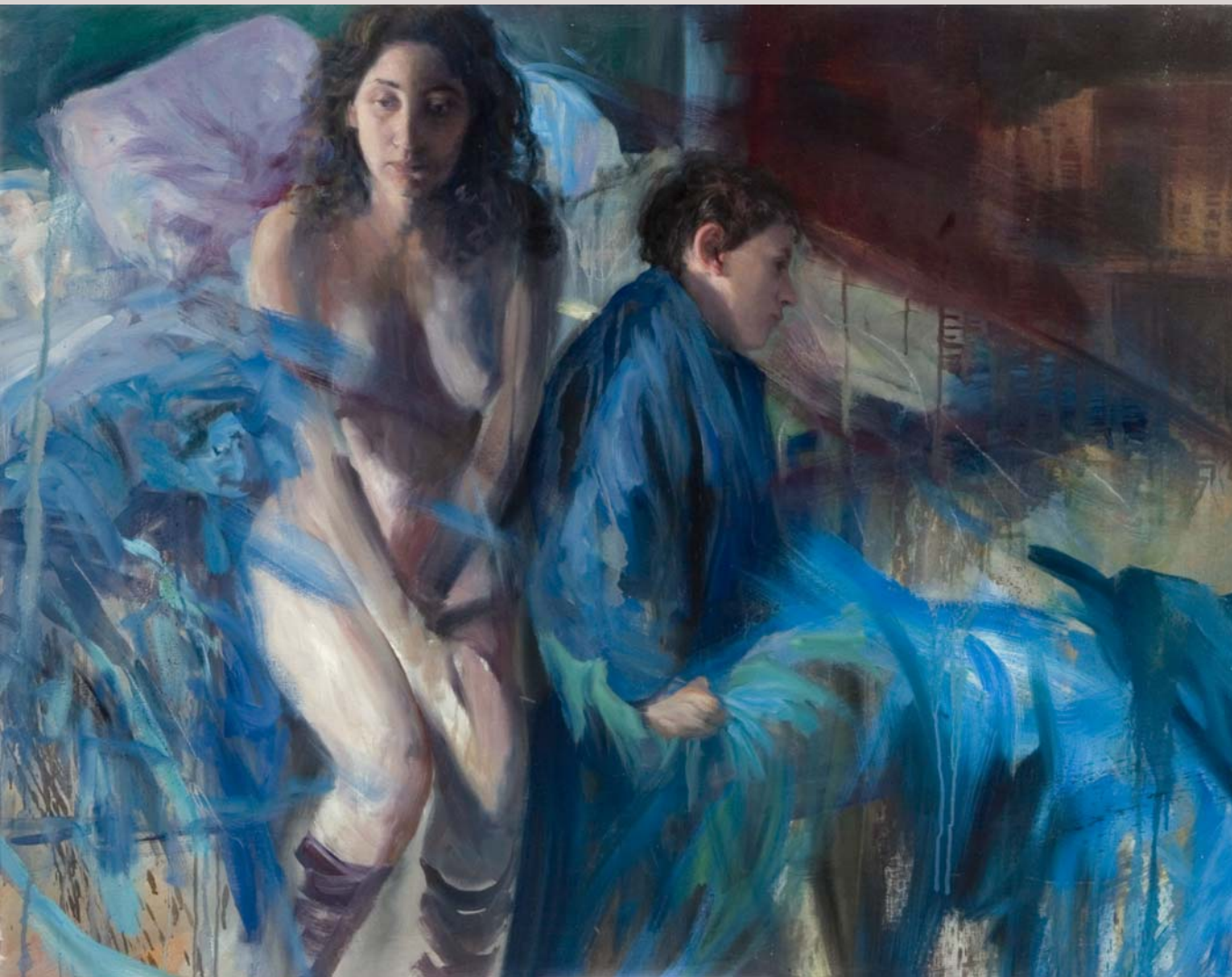
« La mañana » 2007 Huile et alkyd sur toile 114 x 89 cm.